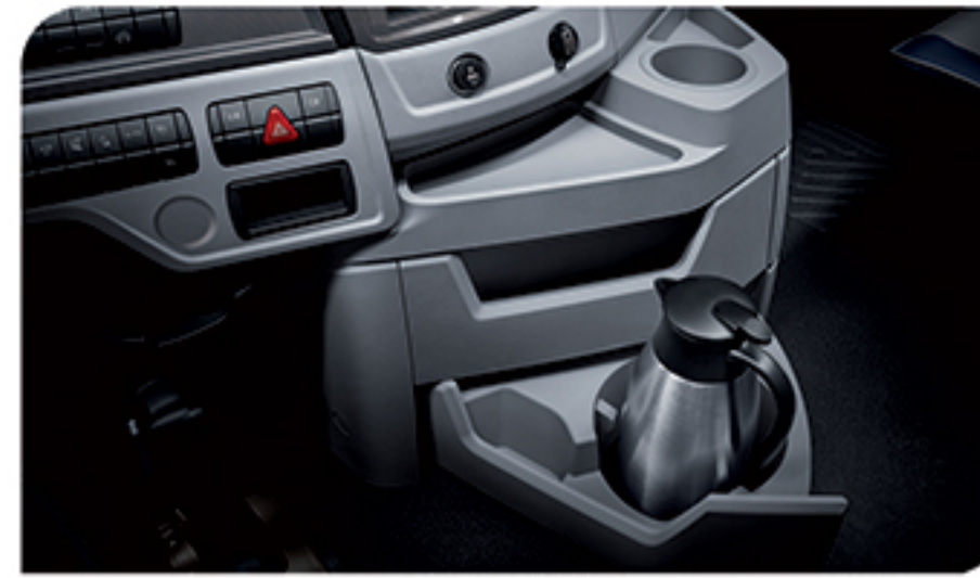
- محفظه های متعدد جهت نگهداری وسایل