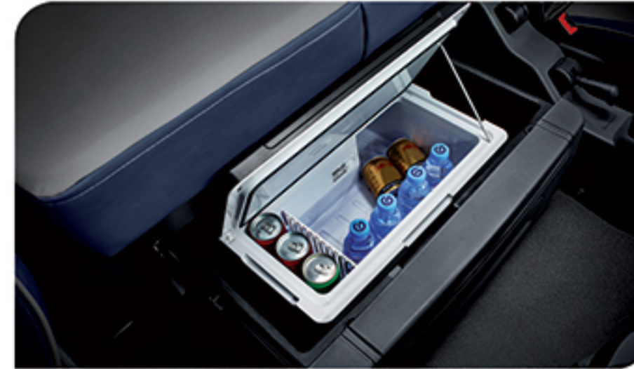
- مجهز به یخچال مسافرتی در زیر تخت