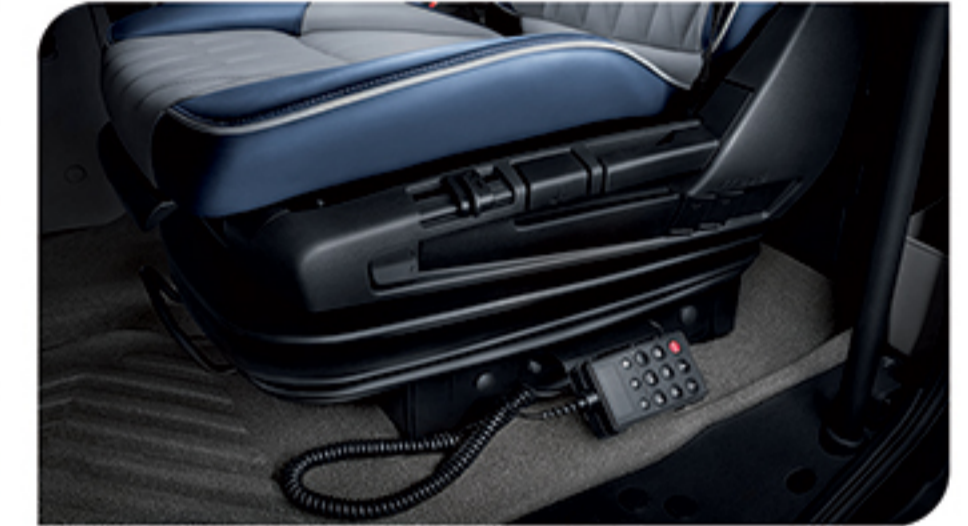
- صندلی راننده با سیستم تعلیق بادی و قابلیت تنظیم در ۶ جهت