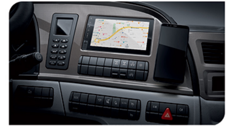
- مولتی مدیا TFT لمسی (رادیو، رهیاب، بلوتوث، USB، SD)