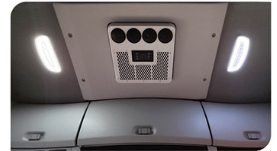
- کولر درجا