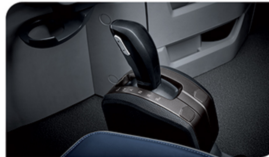
- دسته دنده مدرن (تعویض دنده اتوماتیک و دستی)