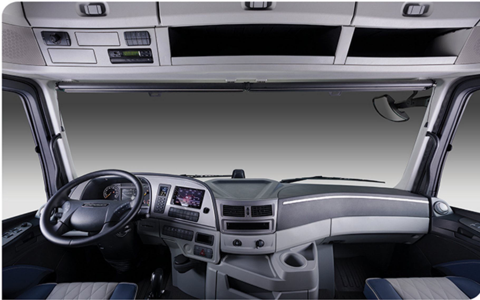
- کابین ارگونومیک و مدرن