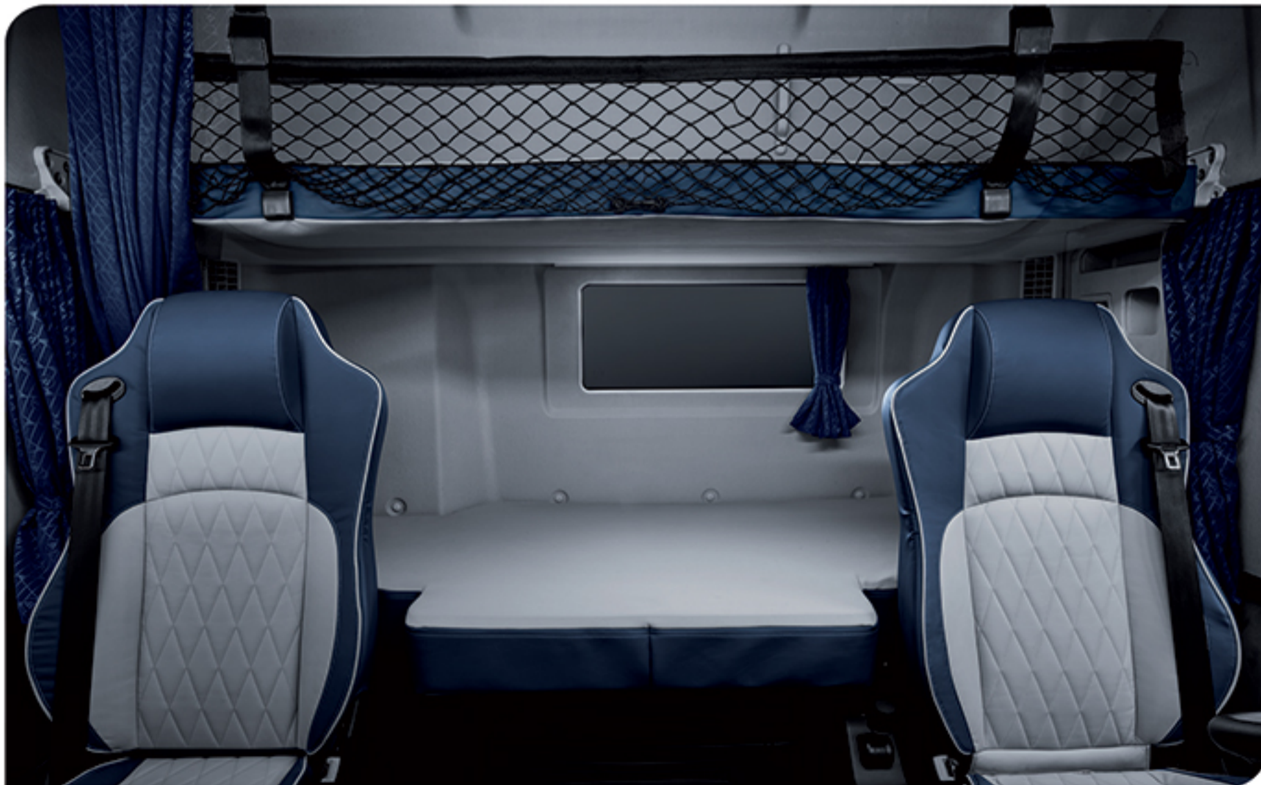
- دارای دو تخت خواب بزرگ جهت استراحت راننده و سرنشین