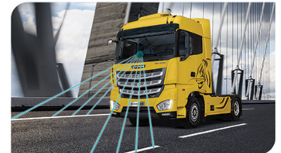
- سیستم هشدار حرکت بین خطوط LDWS

* ممکن است برخی مشخصات و تجهیزات درج شده در این کاتالوگ در هر صورت ملاک نهایی، مشخصات خودروی آماده تحویل می باشد.